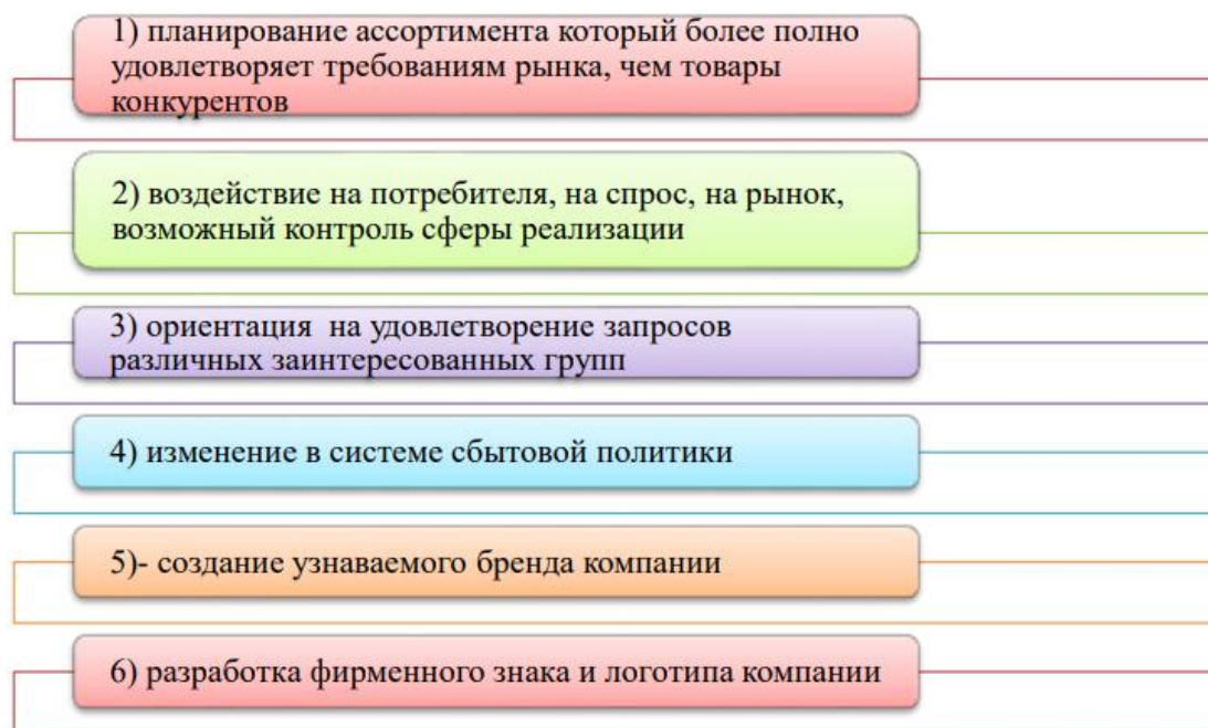
Рисунок 2 - Механизм разработки товарного ассортимента в ООО «СвитовитСтрой»

Анализ существующих механизмов разработки товарного ассортимента в ООО «СвитовитСтрой», позволил определить направления по формированию товарной политики в этой области